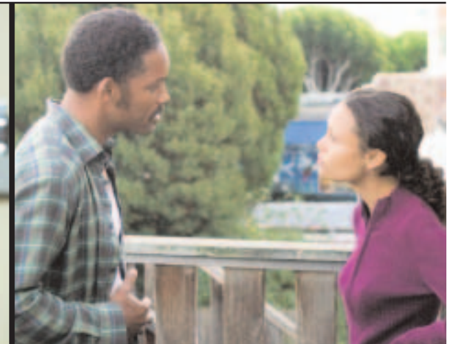
Will Smith, Thandie Newton e Jaden Smith in alcune scene dal film