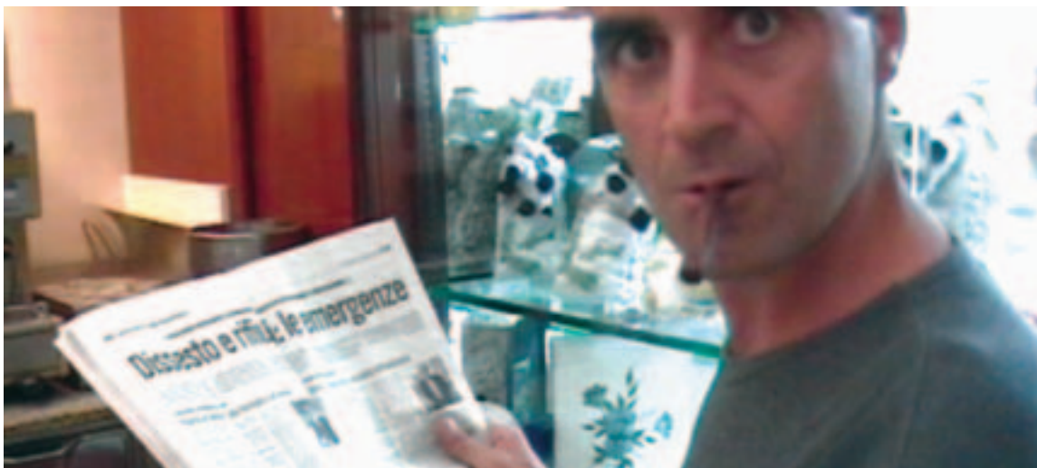
Alcune scene dal film Vedi Napoli e poi muori